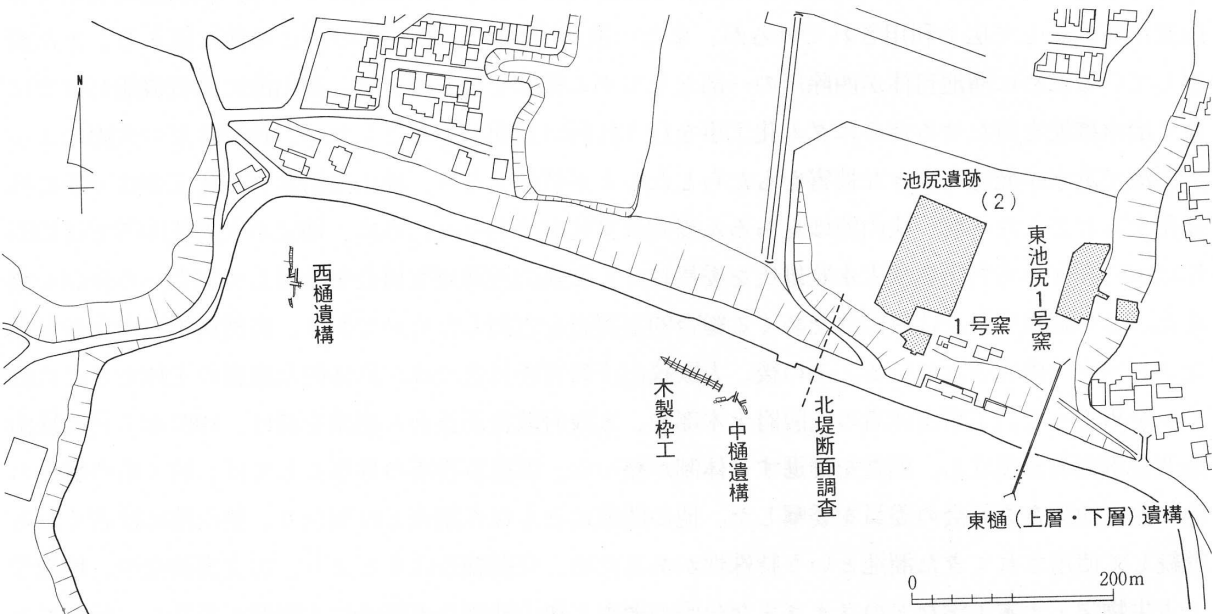
図1 狭山池北堤付近の遺構位置図 (S=1/7,500)